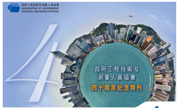
團結技術與測量 維護權益顯力量 40th Anniversary 1976 - 2016

4A 會是怎樣成立的? 4A 會為何成立、宗旨是甚麼? 為何簡稱 4A 會? 何時我們的職級名稱改為技術主任及測量主任? 早期未購置會址、理事們竟曾於俗稱棺材舖的長生店處理會務? 以上問題的答案皆可在紀念特刊中找到。特刊內亦有四位前會長的訪問、4A 會的發展歷史、四十年來的大事記錄及相片供各位參閱。